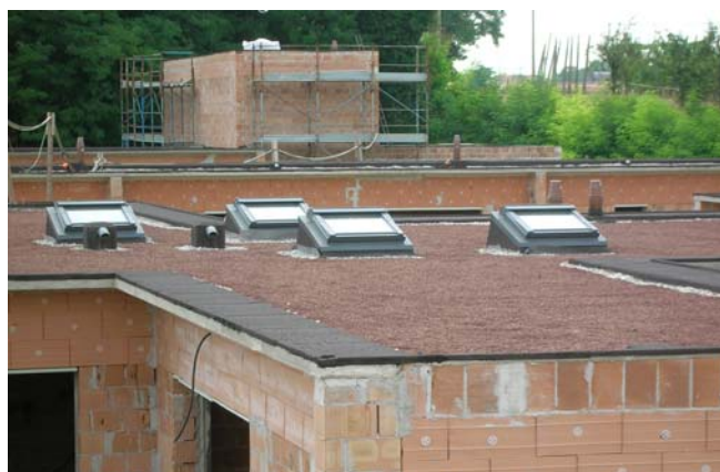
Cantiere in fase di realizzazione con finestre per tetti piani con basamento VELUX